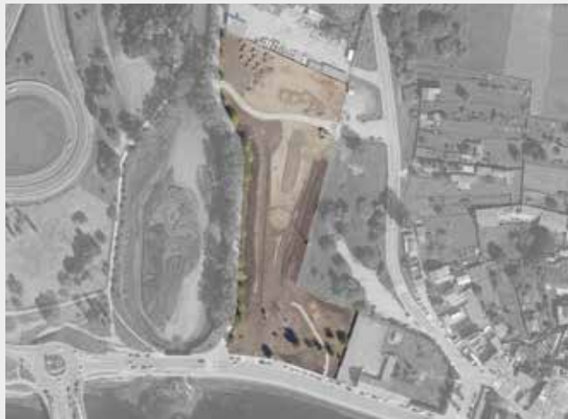
Estado das parcelas no ano 2023