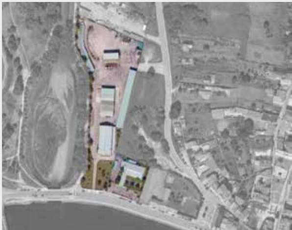
Estado das parcelas no ano 2021