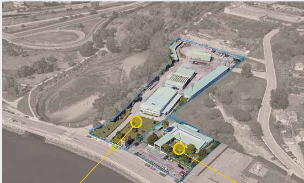
Parcela do antigo Parque de Maquinaria