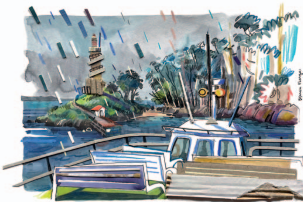
Blanca Escrigas: Illa de Tambo

estudou arquitectura, e iso fomentou aínda máis a súa paixón polo espazo urbano, a perspectiva, construíla, deformala... En 2017 participou no proxecto Camiña/Camiño de El Patito Editorial, no que, con outras tres ilustradoras, fixo o Camino Portugués da costa co fin de elaborar unha exposición e un libro, o cal se converteu nun grande impulso para consolidar o desexo de seguir por este camiño. En 2019 publicou o conto infantil Allá en los mares , ademais de continuar traballando en talleres, exposicións, ilustración editorial e cadernos persoais.