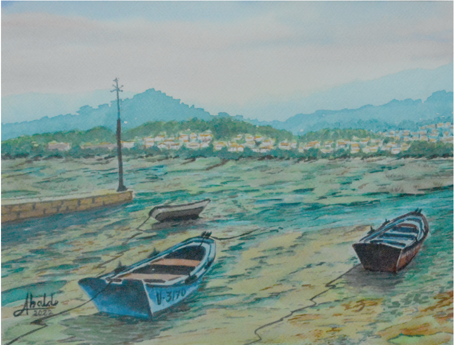
Esperando la subida de la marea