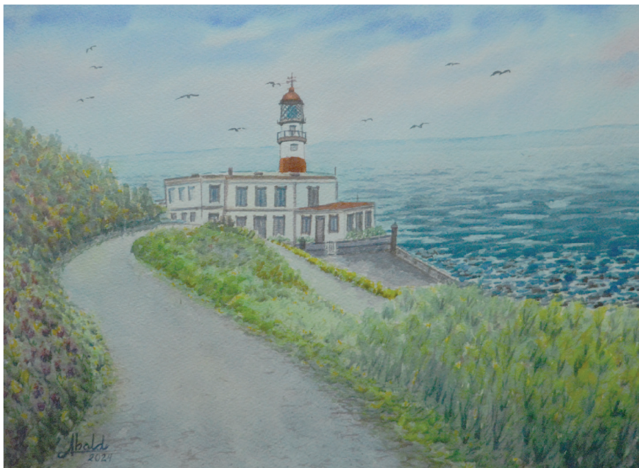
Faro Silleiro. Baiona