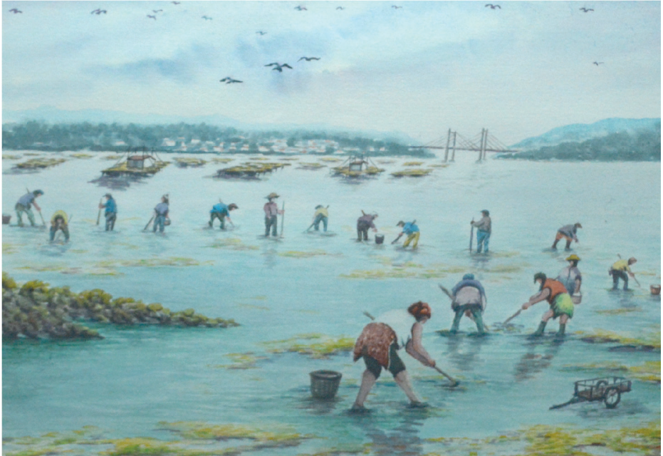
Mariscadoras en la ría de Vigo