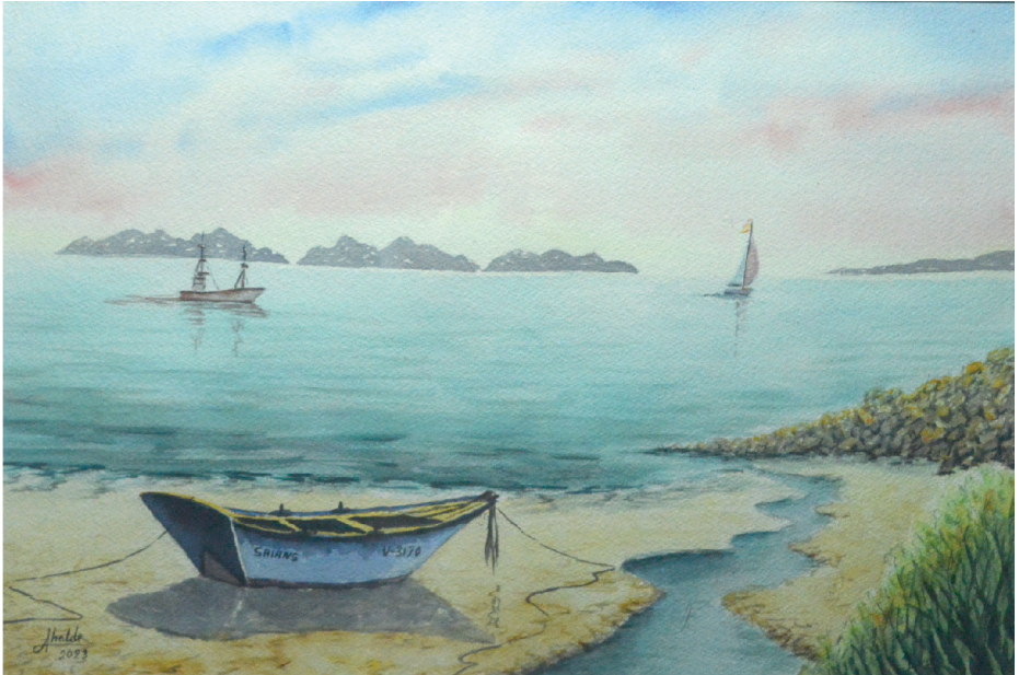
Navegantes al alba