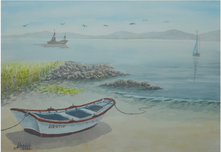
Silencio en la ría