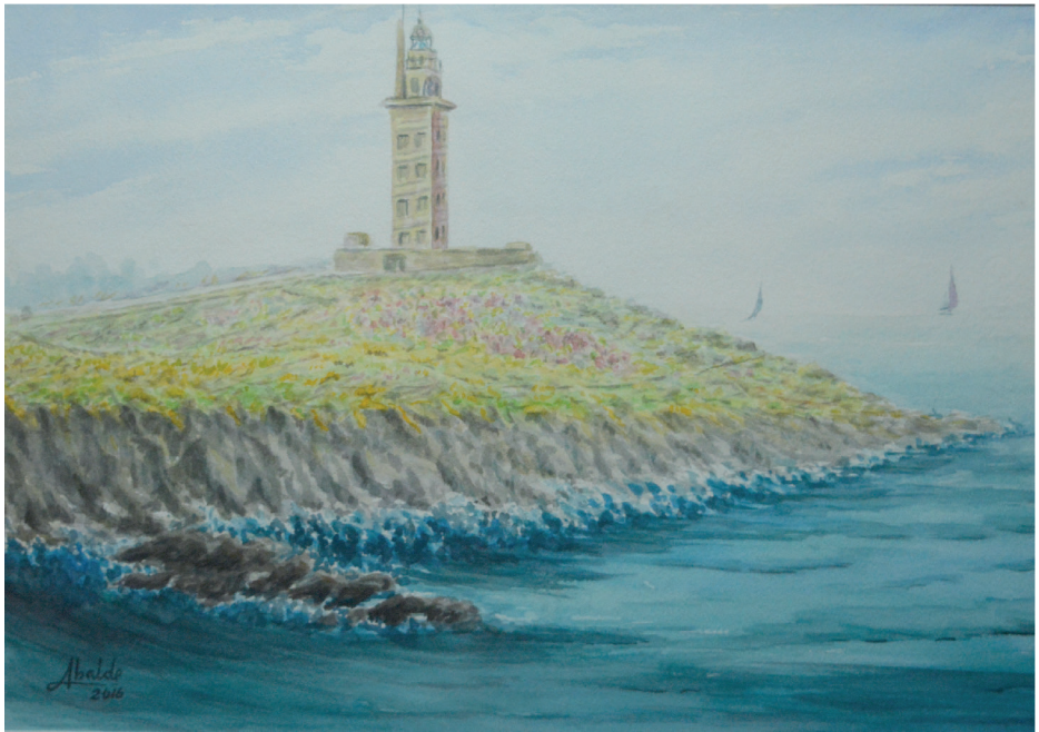
Torre de Hércules. A Coruña