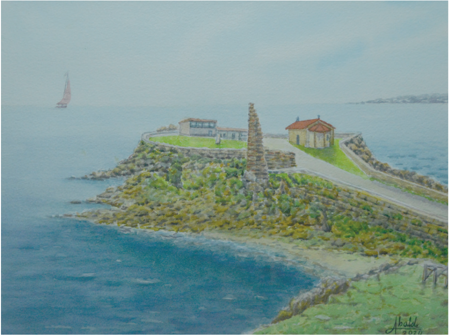
Ermita de Nuestra Señora de A Lanzada