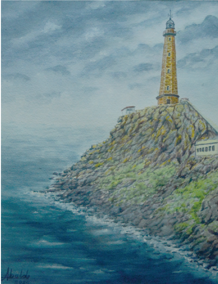
Faro Vilán. Costa da Morte, A Coruña