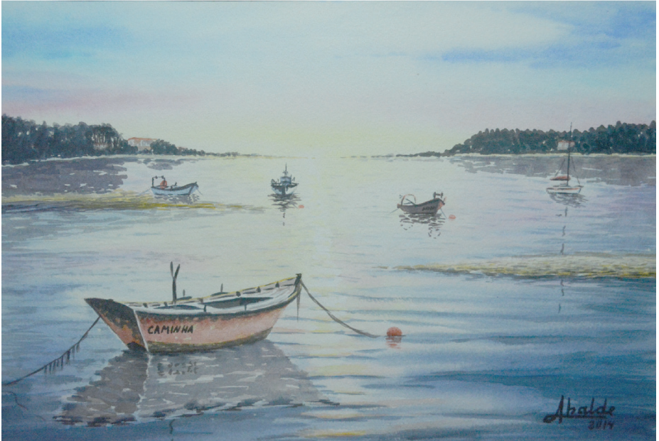
Aguas tranquilas amarradas en el tiempo