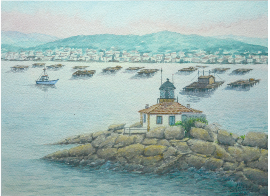
Faro de Punta Cabalo. A Illa de Arousa