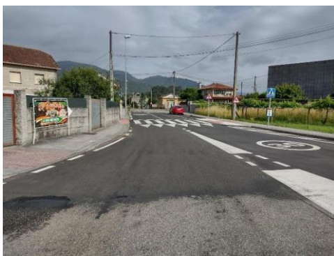
Zona del siniestro recientemente asfaltada.

En relación con el estado actual del firme de la carretera EP-3001, significar que, tras la inspección visual efectuada por un técnico de esta gestora, se observa que recientemente se ha llevado a cabo la renovación de un tramo de la capa de rodadura en ambos carriles de circulación, que incluye la zona del siniestro acaecido. Además, en la zona donde no se realizó el asfaltado se siguen percibiendo agrietamientos del firme en todo el ancho del vial. Lo anteriormente expuesto queda acreditado mediante las siguientes fotografías: