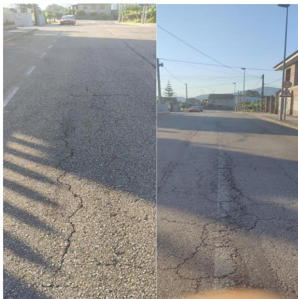
Fisuras/ Agretamentos no vial en toda a súa extensión.