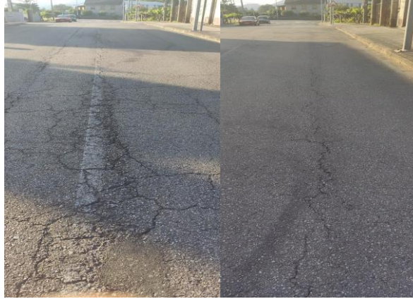
Fisuras/ Agretamentos no vial sobre as zonas de rodadura dos vehículos