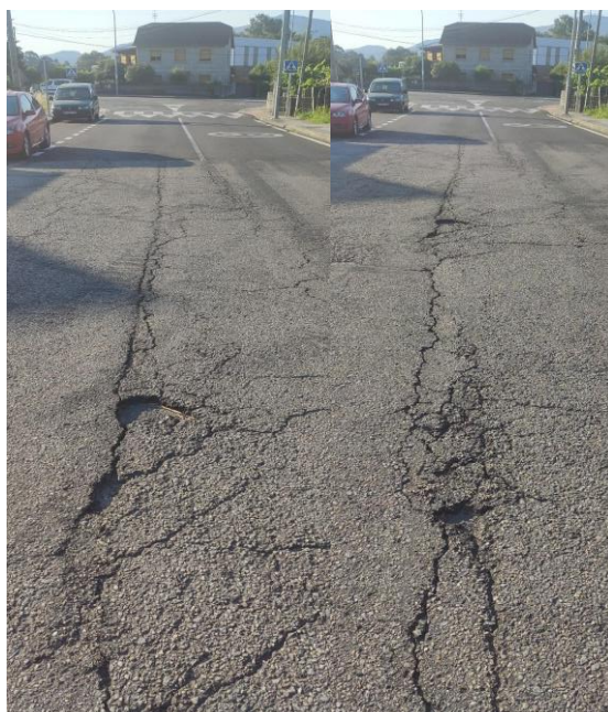
Escamacións no pavimento no carril contrario a traza de saneamento, totalmente fisurado.