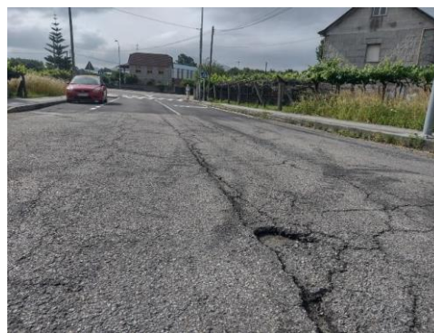
Evidencias del mal estado de la carretera EP-3001.